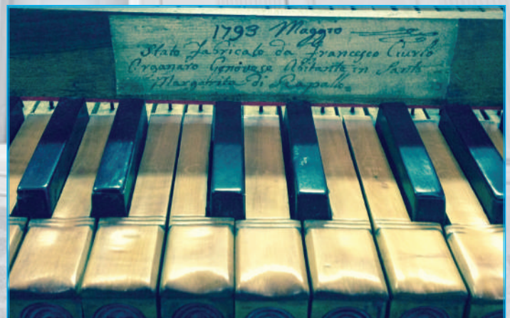
In foto, un primo piano della tastiera dell'organo

L'organo rinnovato sarà benedetto da S.E. il Vescovo Monsignor Alberto Tanasini che sarà tra noi venerdì 14 agosto in occasione del triduo in preparazione alla festa patronale di Nostra Signora Assunta.