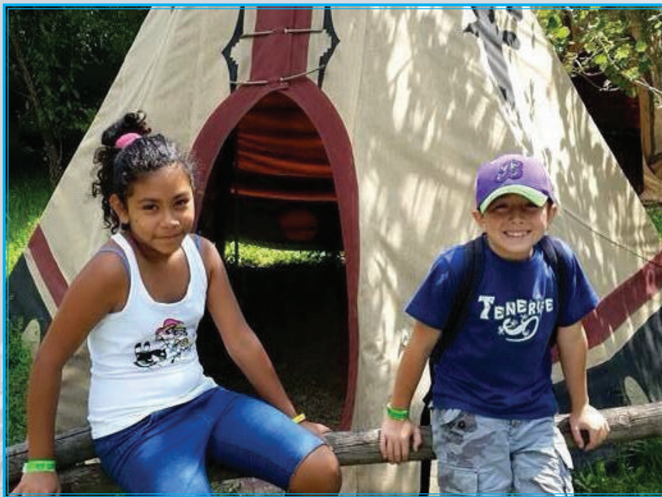
Nelle foto, alcuni momenti della giornata

Ringraziamo Gesù per questa bellissima giornata insieme e vi aspettiamo in autunno per iniziare un altro anno insieme.