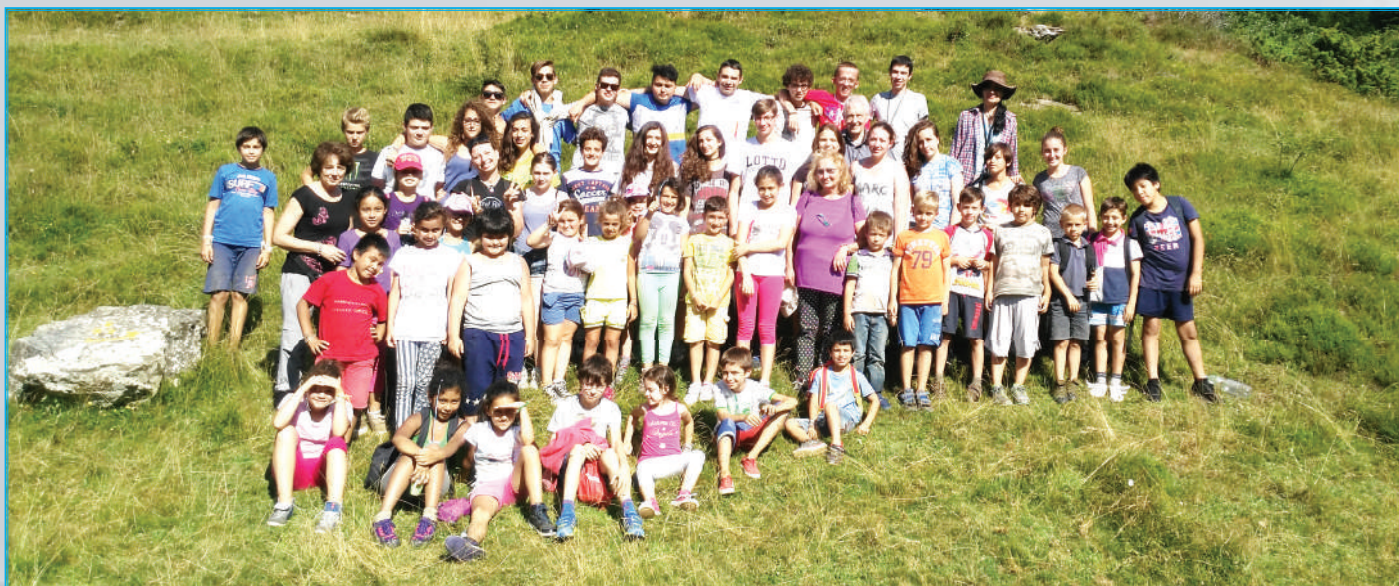
Foto di gruppo dei ragazzi partecipanti al campo

Come ogni anno si è svolto il campo parrocchiale, in grado di trascinare chiunque nell'emozione fraterna dell'amicizia.