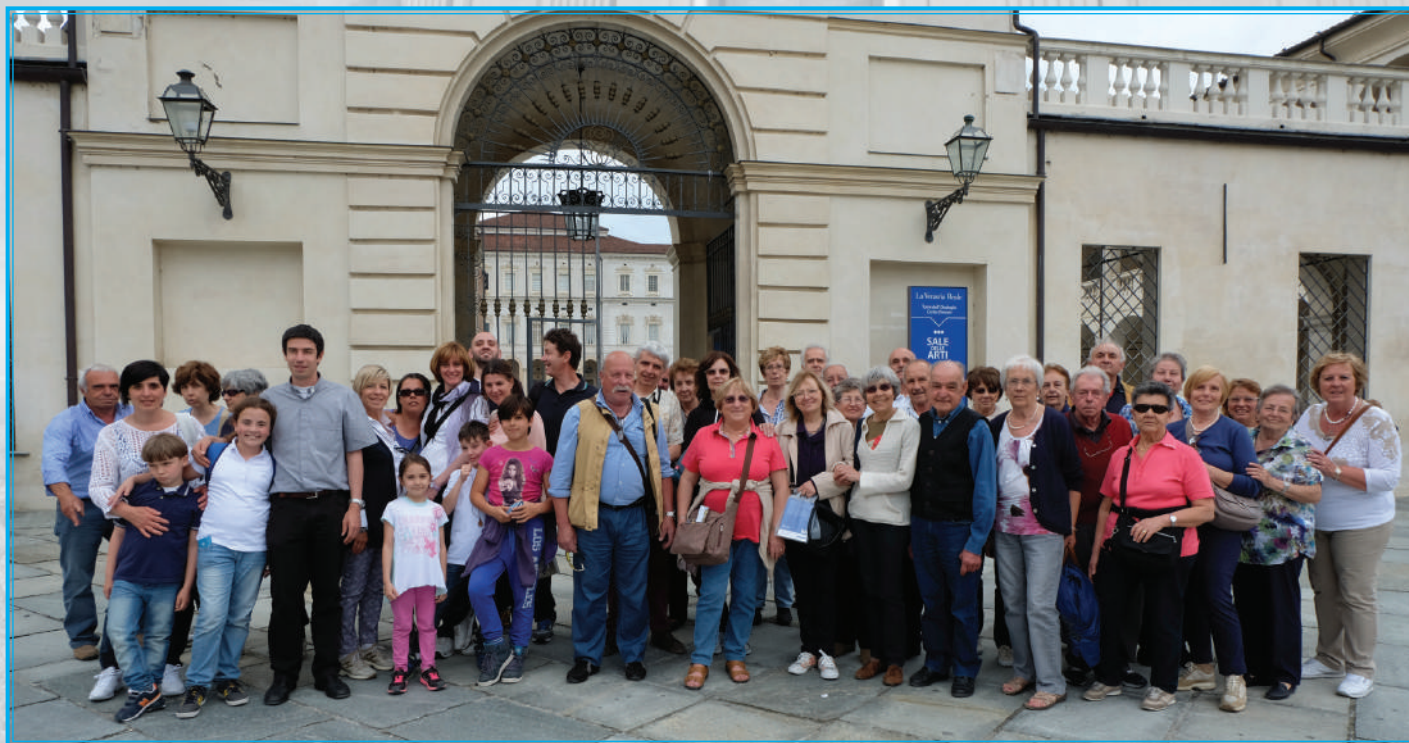
Domenica 24 maggio 2015: foto di gruppo dei partecipanti alla gita a Colle Don Bosco e Venaria Reale