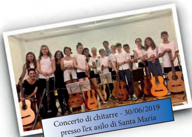
Concerto di chitarre - 30/06/2019 presso l'ex asilo di Santa Maria