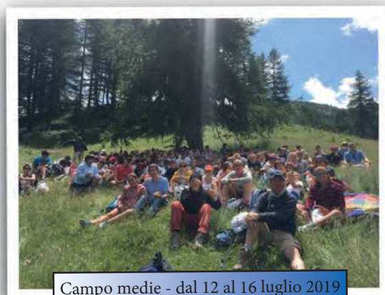
Campo medie - dal 12 al 16 luglio 2019 a Sestriere