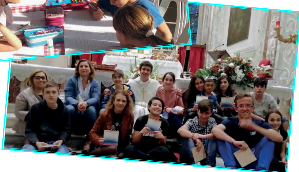
Discepoli che credono