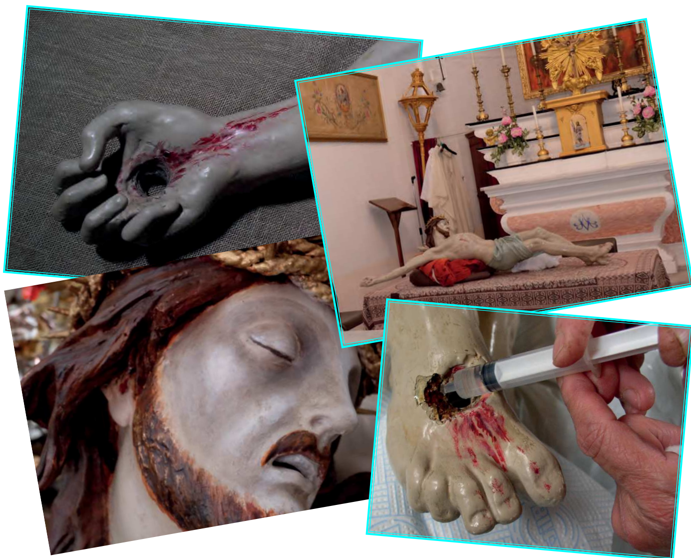
Nelle foto, alcuni particolari della scultura oggetto di restauro