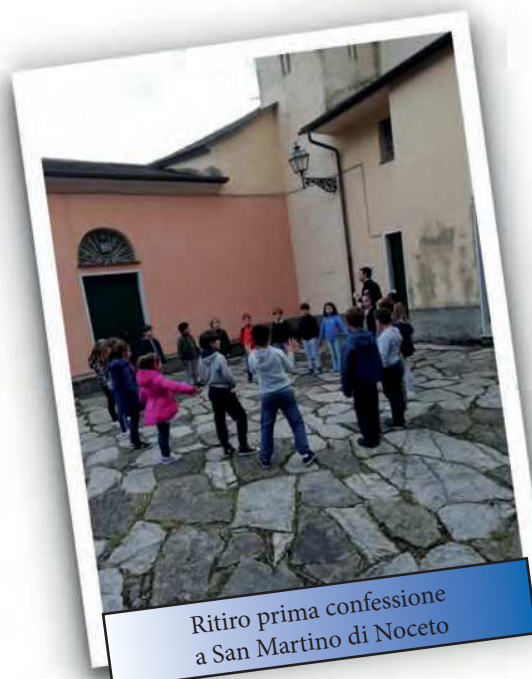
Ritiro prima confessione a San Martino di Noceto