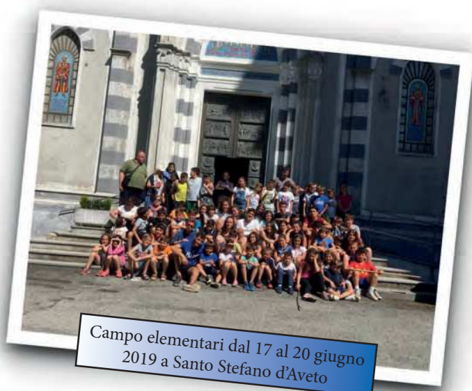
Campo elementari dal 17 al 20 giugno 2019 a Santo Stefano d'Aveto