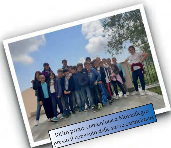
Ritiro prima comunione a Montallegro presso il convento delle suore carmelitane