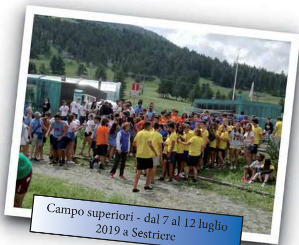
Campo superiori - dal 7 al 12 luglio 2019 a Sestriere