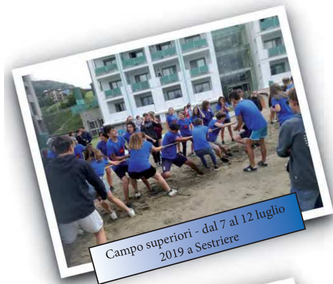
Campo superiori - dal 7 al 12 luglio 2019 a Sestriere