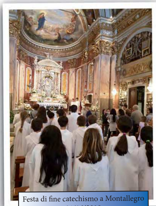
Festa di fine catechismo a Montallegro 01/06/2019