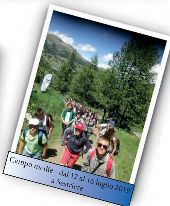
Campo medie - dal 12 al 16 luglio 2019 a Sestriere