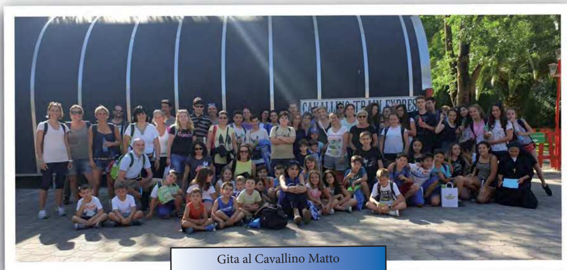
Gita al Cavallino Matto 08/06/2019